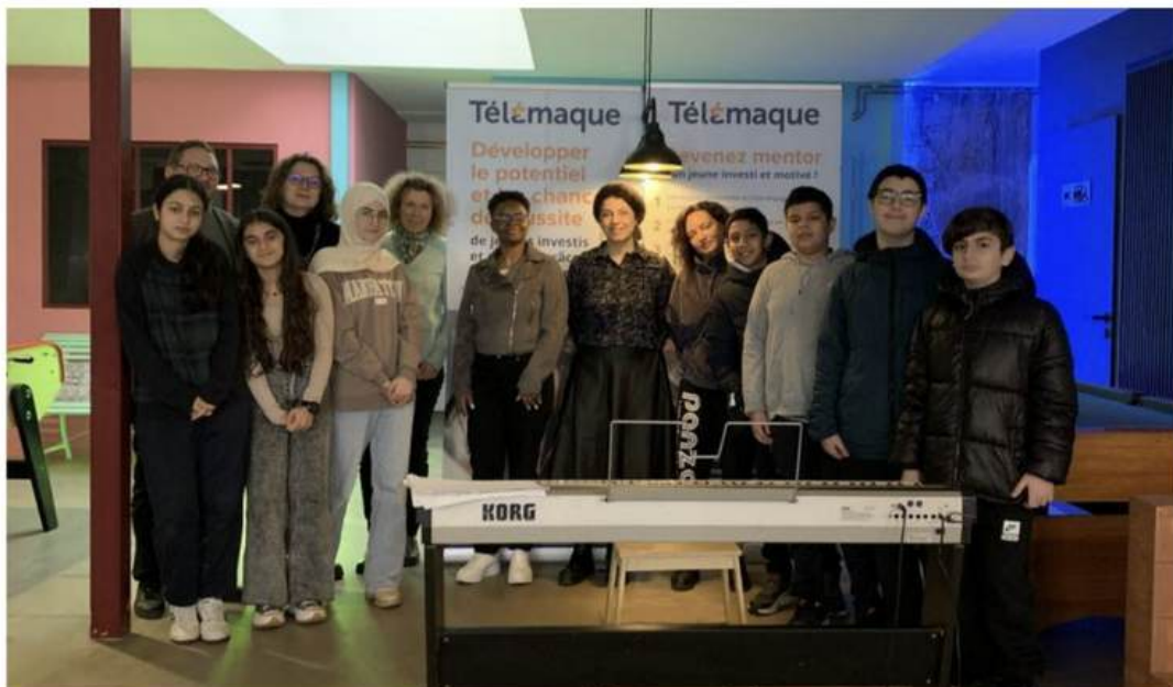
L'association a célébré ses six mois d'implantation à Strasbourg, dans le quartier Gare.