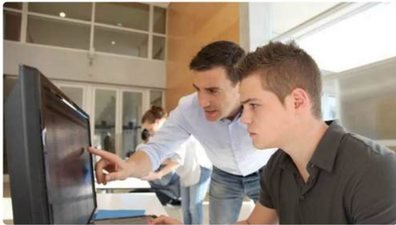
Un étudiant avec son tuteur dans le cadre d'une formation par alternance.

Il y a quelques jours se tenait à Paris, fin avril, la 5e édition du sommet européen du Mentorat, une première en France, en présence de représentants de 25 pays. En quelques années, la France est devenue un leader incontournable sur ce sujet en Europe et dans le monde, le seul pays européen à avoir fait du mentorat une politique publique nationale avec le plan « 1 jeune, 1 mentor ».