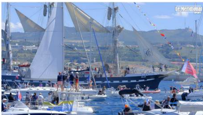
Le Belem au coeur de la parade maritime pour son arrivée à Marseille.

Pour l'arrivée de la Flamme Olympique, l'UNICEF, Télémaque et la Société Nautique de Marseille ont permis à des jeunes de prendre la mer et participer à la grande parade maritime du 8 mai. Reportage à bord du Tintamarre pour accueillir le Belem dans la rade de la cité phocéenne.