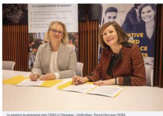
La signature du partenariat entre l'IESEG et Télémaque